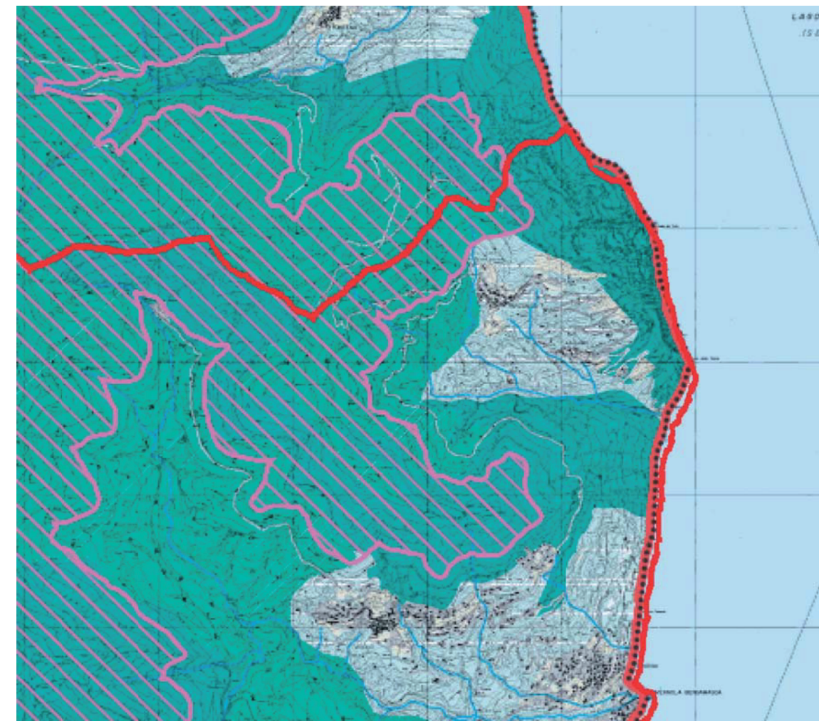
E2_2.2.m tutela, riqualificazione e valorizzazione ambientale e paesistica del territorio scala 1:25000