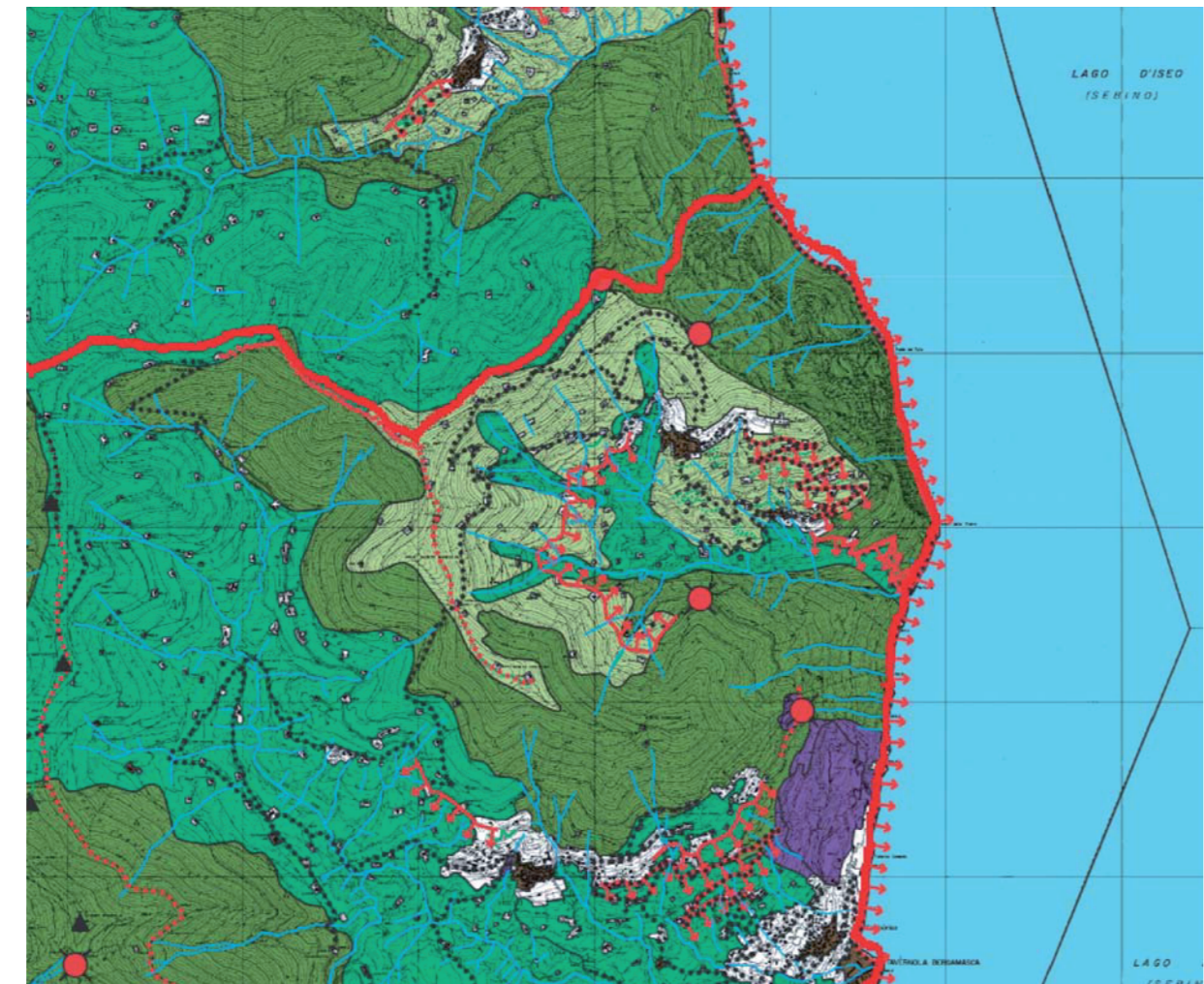
E5_5.4.m ambiti ed elementi di rilevanza paesistica scala 1:25000