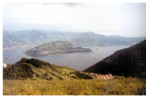
Tavola: 13 Foglio B Scala: 1:2.000

06.12.2012 03.06.2013 20.06.2013 20.06.2013 30.07.2013