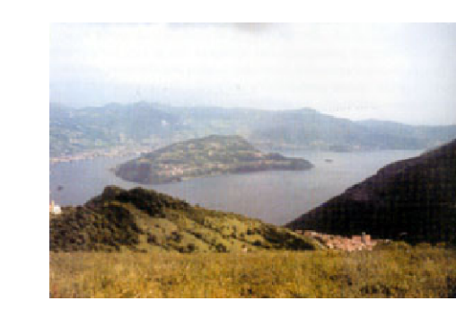
Tavola: 10 Scala: 1:5.000